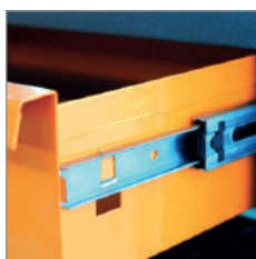
Gavetas com corredeira telescópica.