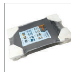
Embalagem única e compacta (plástico termoencolhível)