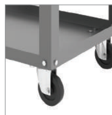
Rodízio de 3".