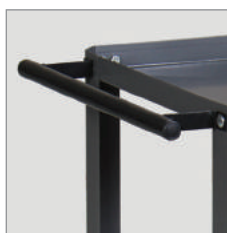
Alça para transporte.